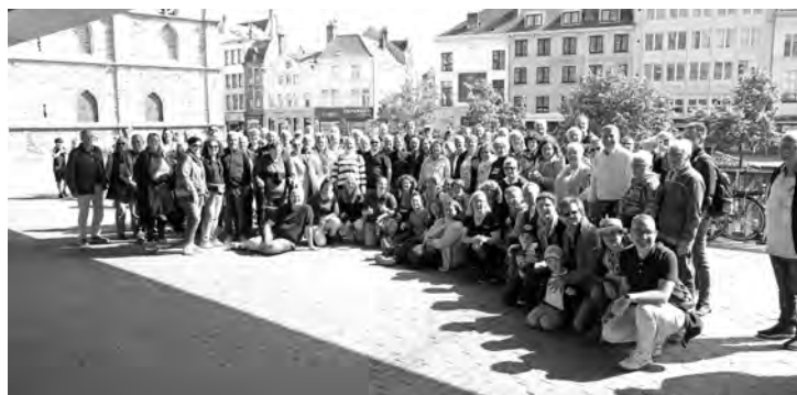
Reisegruppe der Stimmkultur Ötigheim im Zentrum von Gent nach einem Spontankonzert im sogenannten „Schaafstall“.