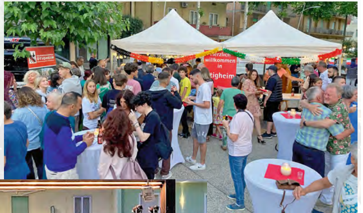
Großer Andrang bei den kulinarischen Angeboten des Ötigheimer Abends