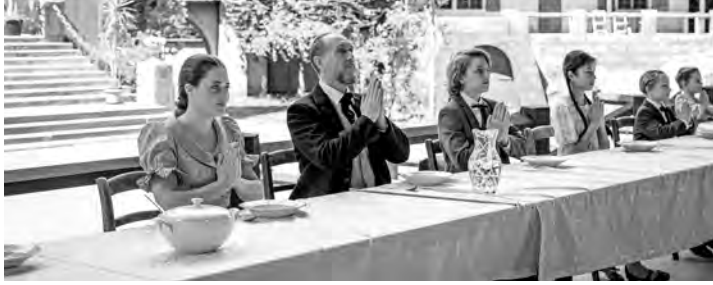
Professor Nägler und seine Familie stehen im Zentrum von Curt Goetz' Komödie „Das Haus in Montevideo“.

Für alle, die am Premierenwochenende nicht dabei sein können: „Das Wirtshaus im Spessart“ und „Das Haus in Montevideo“ werden noch bis jeweils Mitte August in Ötigheim zu sehen sein.