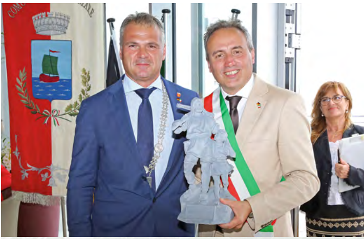
Übergabe des kleinen Tell-Denkmals an Gabicce Mare