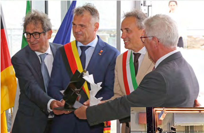
Übergabe des Gastgeschenkes aus Gabicce Mare an Ötigheim