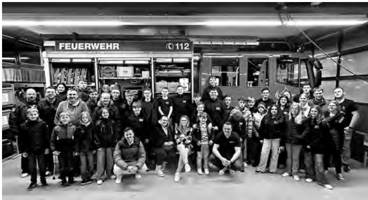
Ein herzliches Dankeschön an die Feuerwehr Weisenbach für die tolle Organisation.

Am Freitag, 13.12.2025 hatten wir unsere Abschlussfeier des Hauses Gryffindor, da wir in diesem Jahr das Zeltlager unter dem Motto Harry Potter zusammen mit den Feuerwehren Weisenbach, Muggensturm und Iffezheim gewonnen haben. Es war ein großartiger Abend, mit viel Spaß und leckerem Essen.