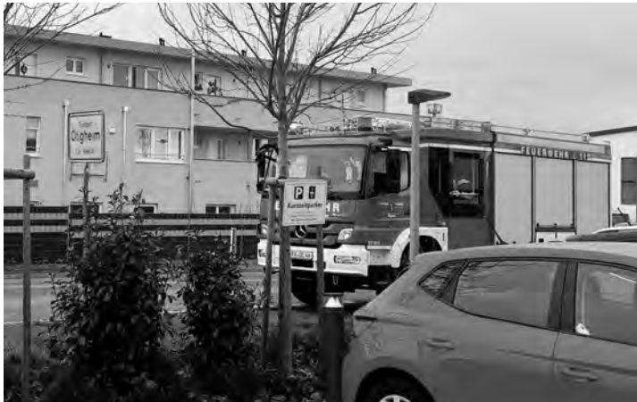
Einsatzende am 10.12.2025 um 11:17 Uhr

Nachdem das Gebäude kontrolliert wurde und keine auffälligen festgestellt werden konnten wurde die Anlage wieder zurückgesetzt sowie dem Betreiber übergeben.