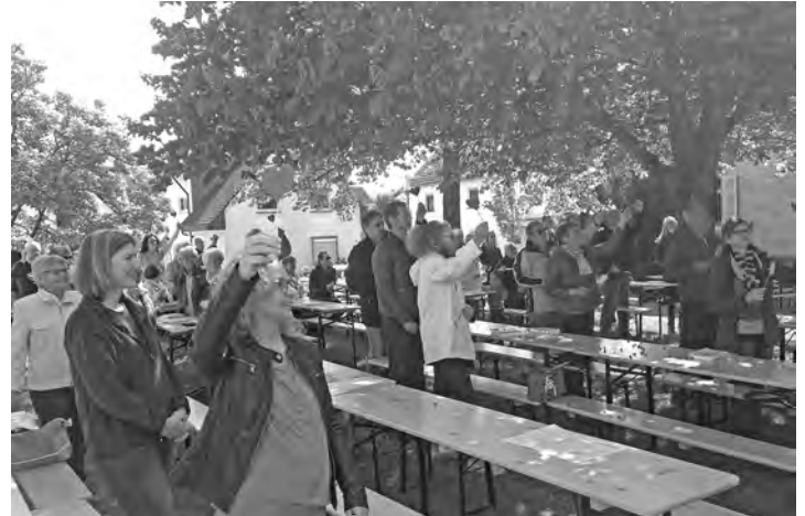
Herz und Sonne waren beim Gottesdienst im Pfarrgarten mit dabei.

Die Gesangsgruppe „Good Vibration“ ergänzte mit gelungener Inszenierung den Sonntagvormittag. Das Gemeindeteam, das das Pfarrfest vorbereitet hatte, wurde tatkräftig von den Grillteams, vielen Helfern in den einzelnen Bereichen und dem Kirchenchor, der das Fest-Café organisierte, unterstützt und so trugen alle gemeinsam zu einem gemütlichen Nachmittag bei. Es tat gut, einfach mal wieder mit Pfarrgarten zu sitzen, sich auszutauschen und verwöhnen zu lassen. Allen Engagierten und besonders auch der KJG für ihre tatkräftige Unterstützung sei herzlich gedankt.