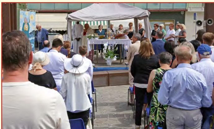
Festgottesdienst zum Partnerschaftsjubiläum