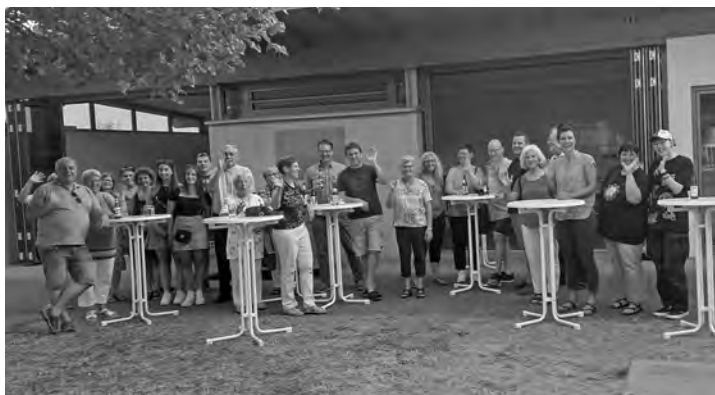
Die Gemeindeteams trafen sich in Ötigheim auf Einladung des Pfarrgemeinderats.

Gerne nehmen die Gemeindeteams Interessierte in ihren Kreis auf und freuen sich, wenn noch mehr Gemeindemitglieder aktiv an einer lebendigen Gemeinde mitarbeiten wollen. Kontakte können über die Pfarrbüros hergestellt werden.