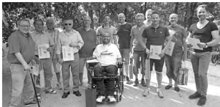
Die TTG ehrte Mitglieder für 25-, 60- und 65-jährige Treue zum Verein...