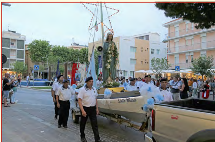
Prozession zu Gedenken Stella Maris