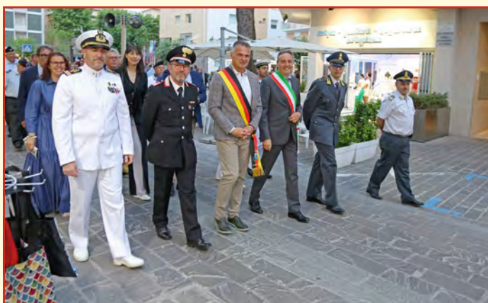
Bürgermeister Frank Kiefer und Bürgermeister Domenico Pascuzzi