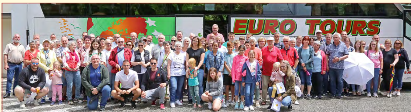
Ausflug nach San Marino