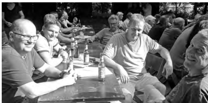
.... und danach wurde richtig gefeiert