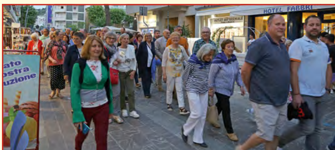
Ötigheimerinnen und Ötigheimer bei der Prozession zu Gedenken Stella Maris