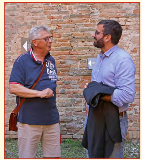
Begrüßung durch den Bürgermeister von Gradara Filippo Gasperi