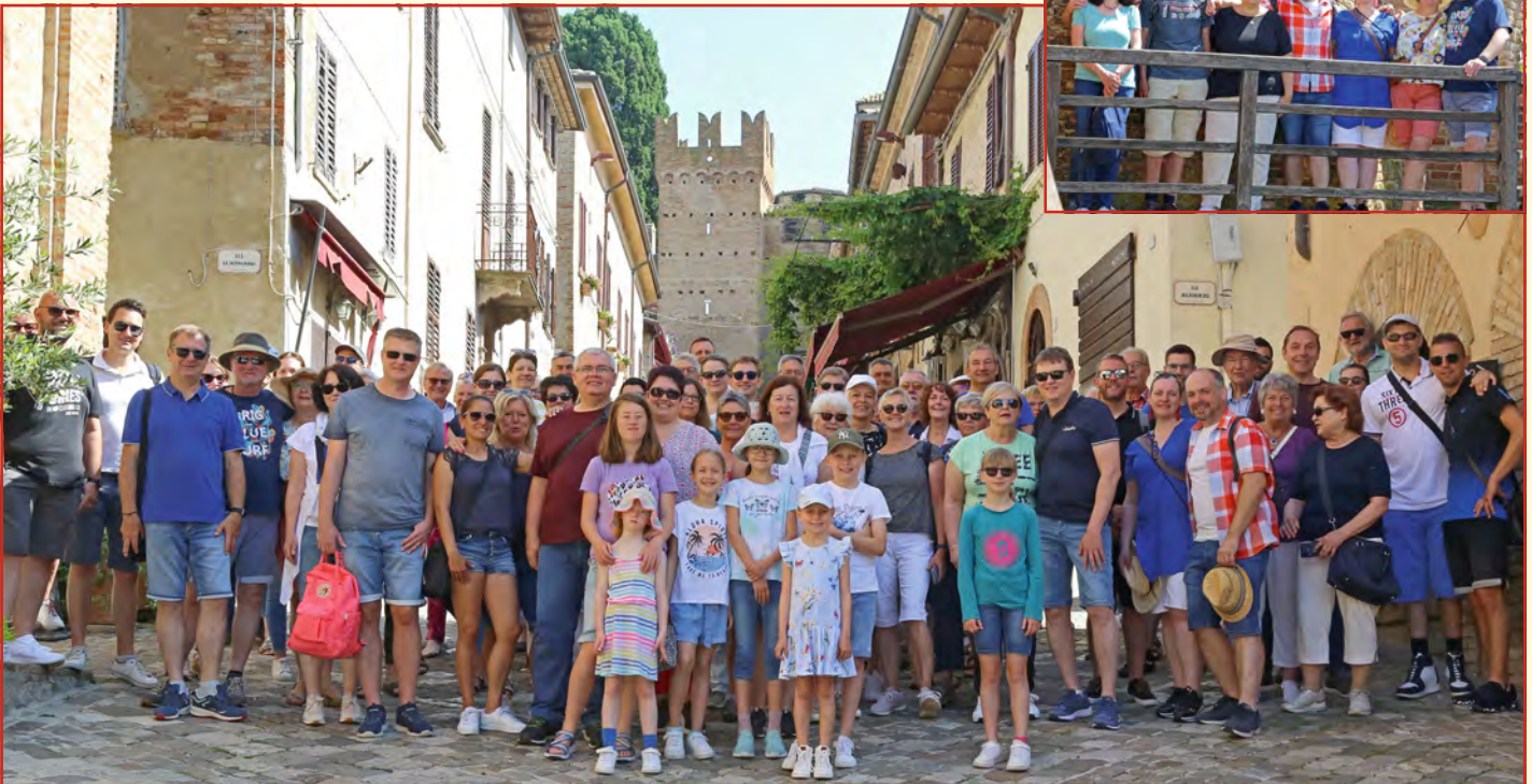
Besuch von Gradara