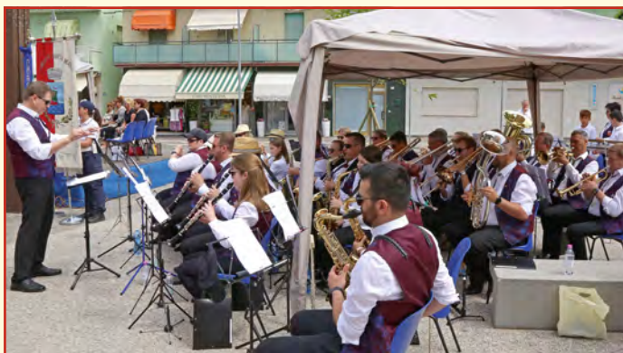
Musikalische Umrahmung des Festgottesdienstes durch den Musikverein Ötigheim