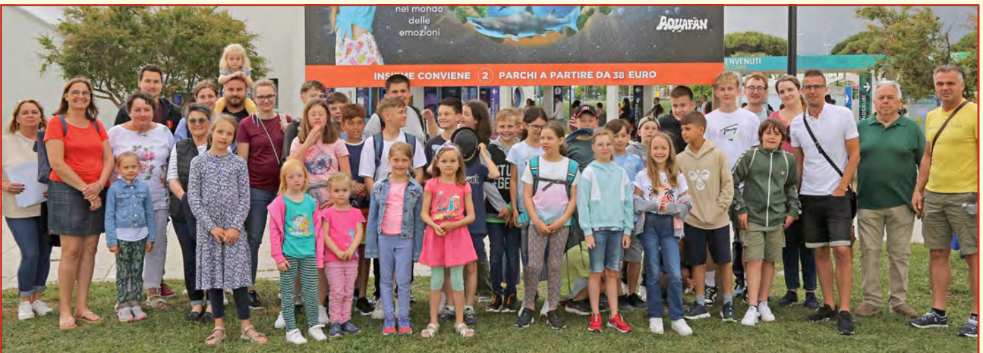
Ausflug der Kinder und Jugendlichen in das Aquarium Cattolica