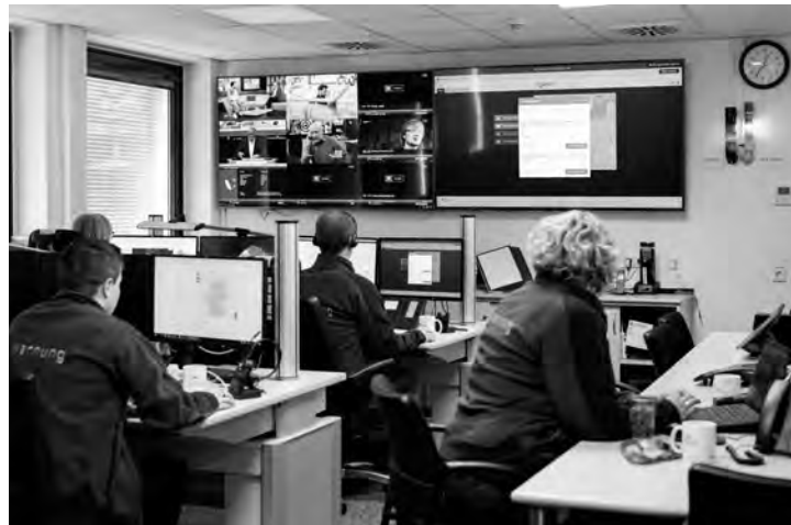
Nationale Warnzentrale beim Bundesamt für Bevölkerungsschutz und Katastrophenhilfe (BBK)

Mithilfe des Modularen Warnsystems wird eine Probewarnung an alle daran angeschlossenen Warnmultiplikatoren versendet. Warnmultiplikatoren sind ein Adressatenkreis, der Warnmeldungen weitergibt. Hierbei kann es sich zum Beispiel um einen Radio- oder Fernsehsender handeln, der seine laufende Sendung unterbricht und die Meldung verliert beziehungsweise einen Lauftext in die laufende Fernsehsendung einblendet, oder eine Leitstelle, die ihre Sirenen auslöst.