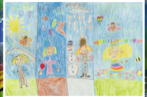
Lara Isele, 6 Jahre, Würmersheim, Thema: Jahreszeiten