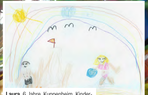
Laura, 6 Jahre, Kuppenheim, Kindergarten Arche Noah, Thema: Sommer