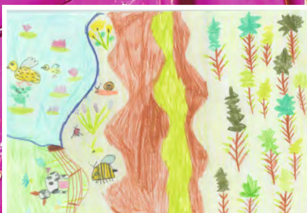
Leni Hutt, 6 Jahre, Rheinstetten, Thema: Frühling