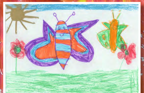
Leni, 7 Jahre, RWG-Schule Neuburgweier, Thema: Frühling