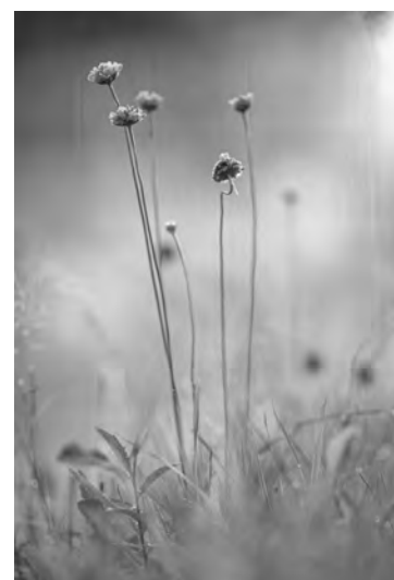
Sandgrasnelke am Standort

Wir freuen uns über zahlreiche Teilnahme. Auch Nichtmitglieder sind wie immer willkommen. Bei Regen verschiebt sich der Termin um eine Woche.