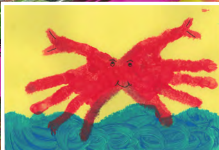
Len Wurz, 6 Jahre, Rastatt, Thema: Sommer