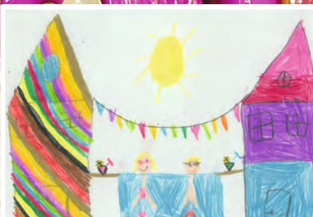
Lenja, 7 Jahre, RWG-Schule Neuburgweier, Thema: Sommer