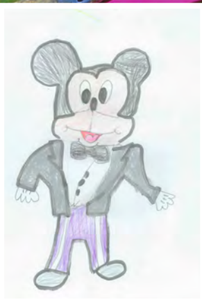
Marlon Lachenmaier , 7 Jahre, Durmersheim