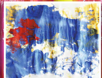
Lilja Kunkis , 2 Jahre, Bietigheim, Thema: Sommer