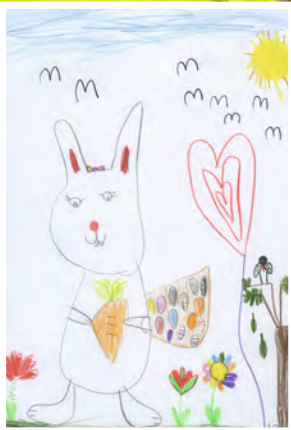
Leonie Oser , 5 Jahre, Bühl, Thema: Frühling