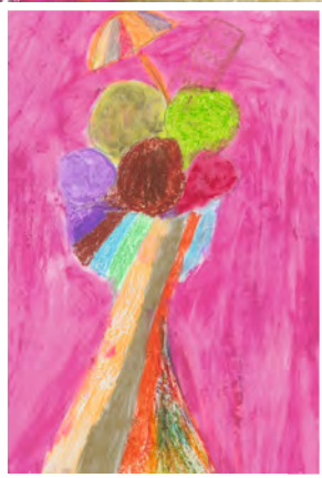
Maja , 7 Jahre, RWG-Schule Neuburgweier, Thema: Sommer