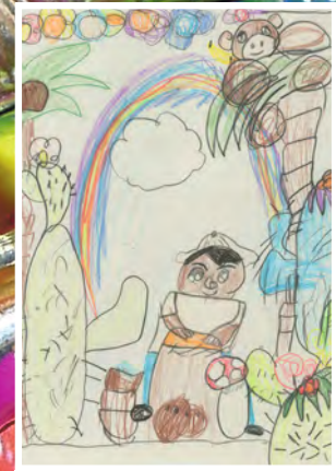
Marlon Lachenmaier , 7 Jahre, Durmersheim