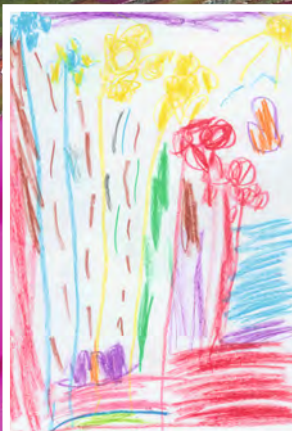
Maryam , 5 Jahre, Kuppenheim, Kin- dergarten Arche Noah, Thema: Frühling