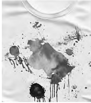
bitte im Altkleidercontainer entsorgen