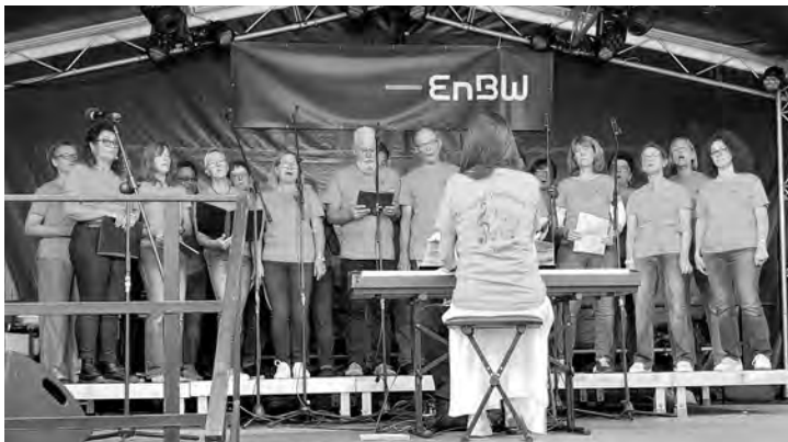
Good Vibrations – Leitung: Uliana Nesterova