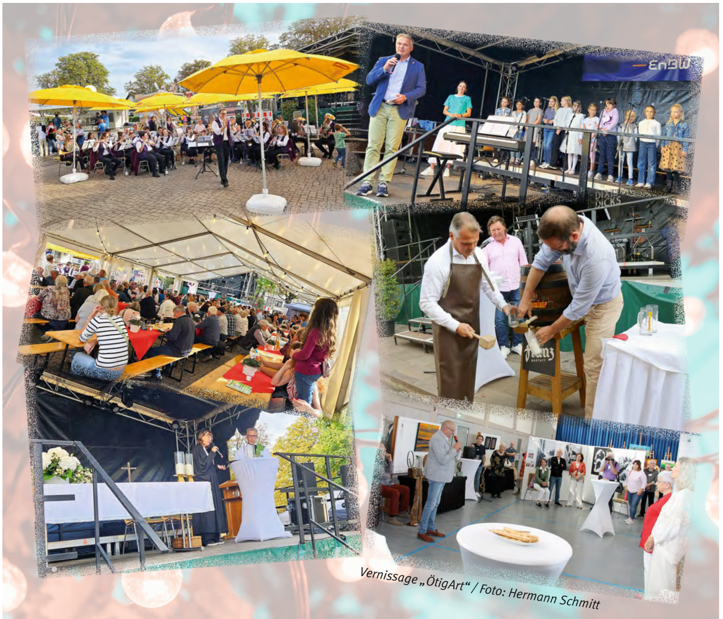
Vernissage „ÖtigArt“ / Foto: Hermann Schmitt