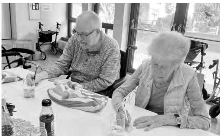
Bevor die Köpfe zum Rauchen gebracht wurden.