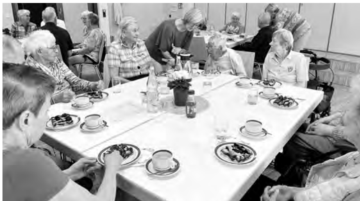
Stärkung bei schmackhaftem Zwetschkuchen der Bäckerei Schröder und Rundum-Versorgung mit Kaffee und Tee.