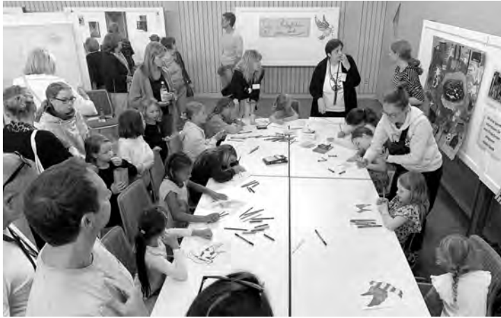
Bei Eltern und Kindern beliebt: Beim Malworkshop am Sonntag herrschte teilweise großer Andrang.

Sehr gut angenommen wurde der von KKÖ-Mitglied Vardaal wieder am Sonntagnachmittag angebotene Malworkshop für Kinder. Zeitweise herrschte an den Malischen großer Andrang. Während der Nachwuchs begeistert malte, standen Mütter oder Väter dabei und hatten Spaß. Der Lohn für die Nachwuchskünstler/innen war ein Teilnahmezertifikat.