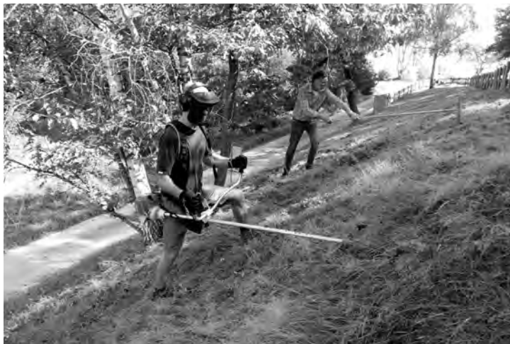
Arbeitseinsatz für die Sandgrasnelke

Am kommenden Samstag, 27. September treffen wir uns um 10 Uhr am Hirschgrund für die Abschlusspflege der Sandgrasnelke. Die Böschung der ehemaligen Kiesgrube muss mit Freischneidern gemäht und das Mahdgut entsorgt werden. Der VUL bringt die erforderlichen Werkzeuge (Freischneider und Rechen sowie Heugabeln) mit. Auch für eine anschließende Verpflegung ist gesorgt.