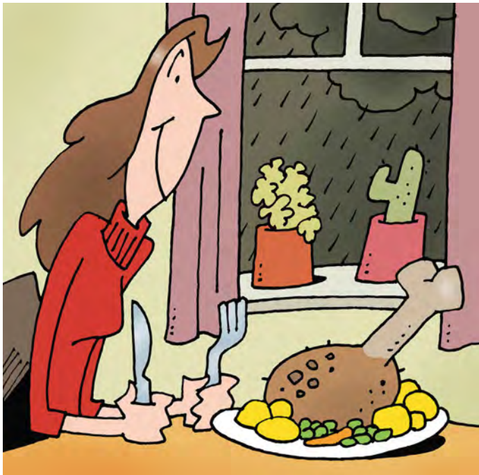
(Text: Glawion/DEIKE, Illustration: Dieter Hermenau)

Wenn der Herbst beginnt, werden die Tage kürzer und dunkler. Stürme und Regenschauer machen es uns noch dazu richtig ungemütlich. Unser Körper reagiert auf diese Umstände mit einer erhöhten Ausschüttung des Hormons Melatonin. Es macht uns müde und schläfrig. Außerdem wird weniger Serotonin ausgeschüttet, das sogenannte Glückshormon. Allerdings können deftige und süße Speisen die Serotoninproduktion steigern – deshalb haben wir größeren Appetit. Zudem sehnen wir uns an trüben Tagen nach wohligen Gefühlen, die beispielsweise durch ein gutes Essen ausgelöst werden können. Leckere Gerichte können dann wahre Seelenröster sein.