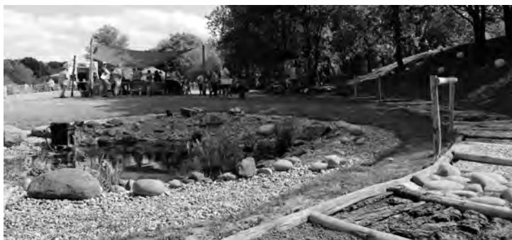
Barfußpfad auf der Umweltbildungsstation Hintere Dollert.