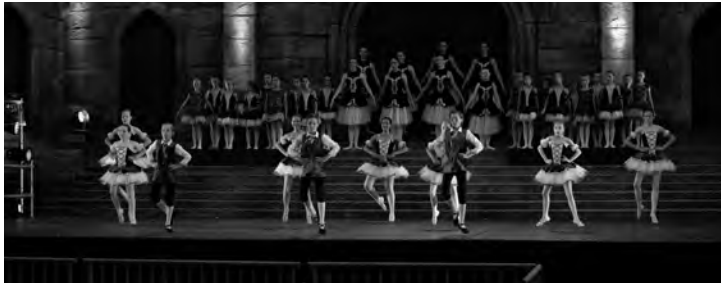
Die Tänzerinnen und Tänzer der Volksschauspiele sind fester Bestandteil der Festlichen Konzerte.

Ein musikalischer Blick über den großen Teich mit dem Orchester, den Tanzgruppen und Chören der Volksschauspiele und renommierten Solisten: Sopranistin Venicia Sandria Rasmussen und der isländische Tenor Einar Dagur Jónsson sind erneut bei den Festlichen Konzerten dabei. Großes Feuerwerk inklusive!