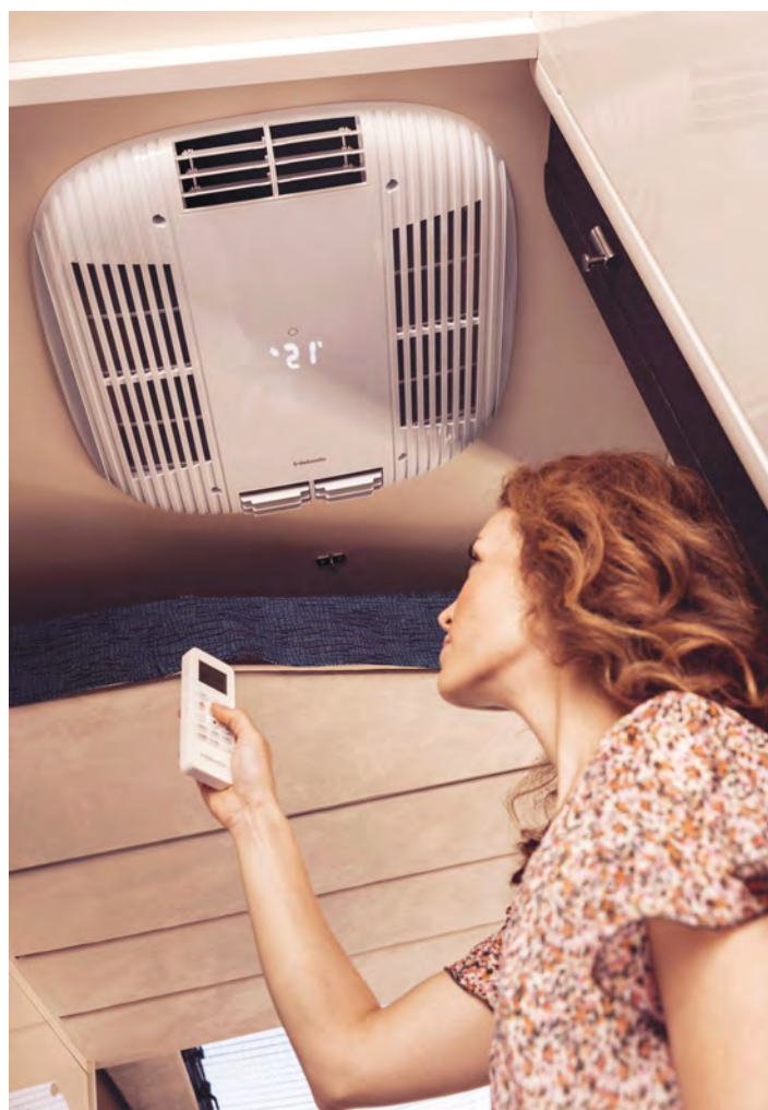
Mit kühlem Kopf die freien Tage genießen: Eine nachträgliche Klimatisierung fürs Wohnmobil erhöht den Komfort unterwegs erheblich.

entweichen kann. Anschließend die Türen, Fenster und Vorhänge schließen, damit das Klimagerät schnell und energiesparend die Innenraumtemperatur absenken kann. Von Zeit zu Zeit empfiehlt es sich außerdem, Laub und Schmutz von der Aufdachklimaanlage zu beseitigen sowie die Abluftfilter zu überprüfen und bei Bedarf zu säubern.