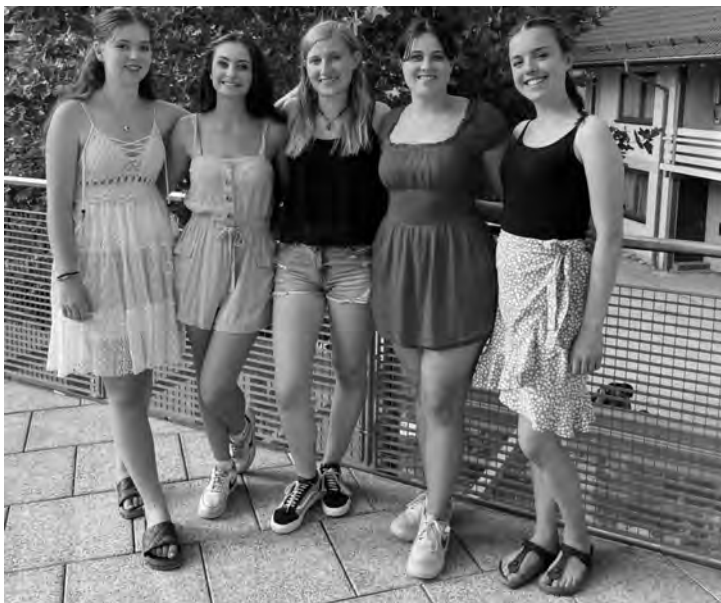
Der neu gewählte Jugendbeirat der VSÖ.