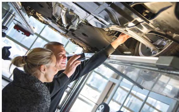
Nach einer gründlichen Fahrzeuginspektion ist das Auto gut gerüstet für eine lange Urlaubsreise.

Ein Check der Klimaanlage gibt den Reisenden die Sicherheit, dass sie auch in südlichen Ländern wohltemperiert unterwegs sind. Die Werkstatt prüft Luft- und Pollenfilter sowie den Stand des Kältemittels.