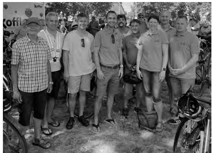
Teilnehmer der ADFC-Demonstration am Samstag, 24. Juni 2023.

Unser Interesse war dabei eine attraktive Route anbieten zu können, die Unfallgefahr zu minimieren und die Gemeindeinfrastruktur nicht zu tangieren. Unsere Hartnäckigkeit hat sich nun bezahlt gemacht und zeigt, dass es möglich ist, mit festem Willen und Engagement politisch etwas zu bewegen. Deshalb danken wir den Verantwortlichen im Regierungspräsidium Karlsruhe für ihr Einlenken.