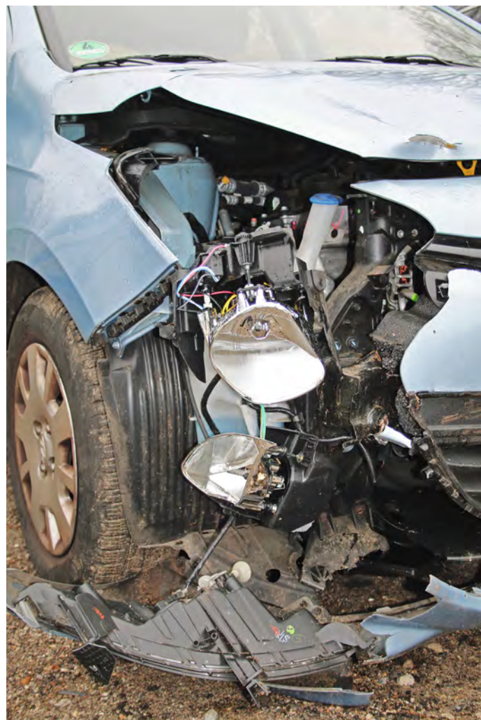
Hier hat es heftig gekracht: Bei einer schwerwiegenden Kollision ist von allen Beteiligten besondere Umsicht gefragt.

Maske dabei hat, muss mit einem Bußgeld rechnen. Autofahrer sollten ihren bisherigen Kasten einfach um die fehlenden Masken ergänzen, sofern er ansonsten alle gesetzlichen Anforderungen erfüllt, etwa im Hinblick auf Vollständigkeit und Haltbarkeitsdatum.