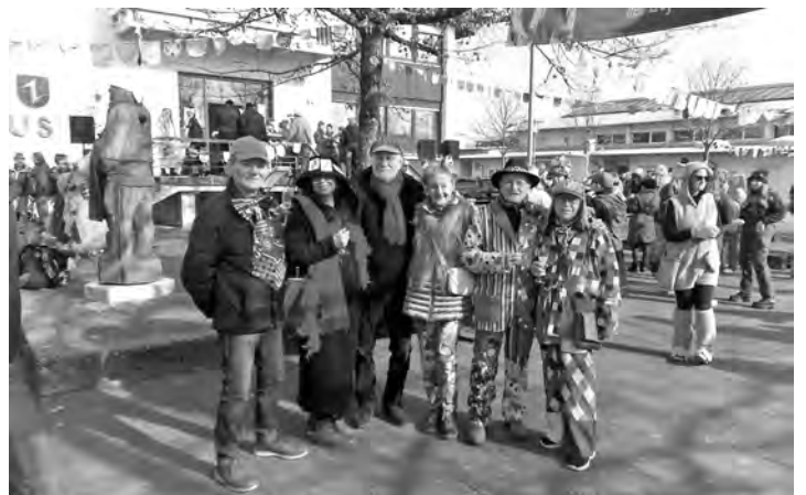
Bunt ist Trumpf: die KKÖ-Mitglieder beim Ötigheimer Rathaussturm am schmutzigen Donnerstag

Weitere Informationen unter www.kuenstlerkreis-oetigheim.de . Kontakt: kk.oe@web.de