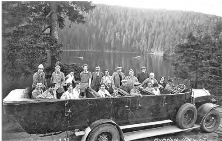
Ausflug an den Mummelsee. Historische Aufnahme von etwa 1925.

Weitere Informationen telefonisch unter 07222/381 3581.