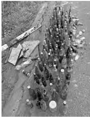
Ein kleiner Auszug an eingesammelten Flaschen entlang der Kreisstraße nach Rastatt/Steinmauern (K3718)

An dieser Stelle sei gerne allen aktiven Helfern, sowie der Gemeindeverwaltung und den Mitarbeitern des Bauhofs für diese tolle Gemeinschaftsaktion für unsere Umwelt gedankt.