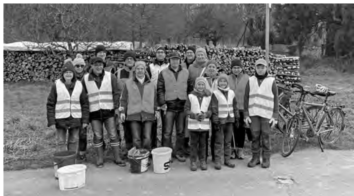
Die FWG-Helferinnenn & -Helfer