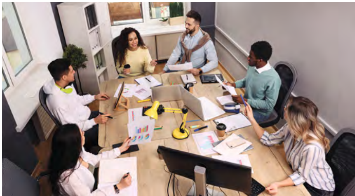
Angesichts des Fachkräftemangels sind Quereinsteiger in vielen Unternehmen herzlich willkommen.

Unternehmen zeigen sich zudem zunehmend offener für Quereinsteiger und sind bereit, Bewerberinnen und Bewerber, die grundsätzlich gut zu ihnen passen, fachlich weiterzubilden. Die Suche nach geeigneten Kandidaten kann jedoch wertvolle Zeit rauben. Gut vernetzte Personaldienstleister vermitteln hier mit geringem Aufwand gute Matches – so gestaltet sich die Suche für beide Seiten einfacher.