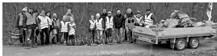
Einsammel-Ende nach zwei Stunden