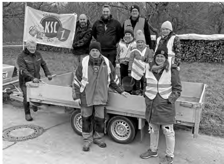
Die Helfer vom KSC-Fanclub Etje

Wir möchten allen Organisatoren dieser tollen Aktion danken und beim nächsten Mal wollen auch wir wieder dabei sein.