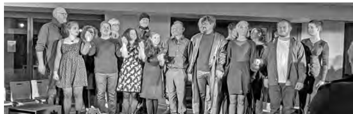
Erfolgreiche Premiere für das „Antigone“-Ensemble.

vielfach gratuliert und gedankt. Wer sich von der außerordentlichen Leistung der Darsteller überzeugen möchte, kann dies noch an drei weiteren Wochenenden tun. Gespielt wird immer Freitag- und Samstagabend ab 20:00 Uhr. Letzte Karten gibt es noch im Internet, der Geschäftsstelle und der Abendkasse.