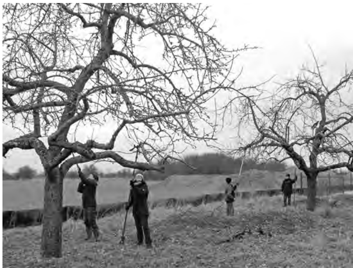
Baumschnitt Januar 2022

Unsere ersten beiden Arbeitseinsätze des Jahres wollen wir am 21.01.2023 und 28.01.2023 durchführen. Wir werden wie jedes Jahr die Obstbäume auf der Hardt schneiden. Treffpunkt ist am Samstag, 21. Januar, um 13:00 Uhr auf dem Penny-Markt-Parkplatz. Für den Arbeitseinsatz planen wir erfahrungsgemäß etwa drei Stunden ein. Wer eigene Baumscheren und Baumsägen hat, bringt diese gern mit. Für alle ohne eigenes Werkzeug haben wir aber ausreichend Geräte dabei. Weniger Sachkundige werden gerne unterwiesen und sind ebenso wie Nicht-Mitglieder herzlich willkommen. Bei Frost oder Regen verschieben sich die Termine jeweils um eine Woche.