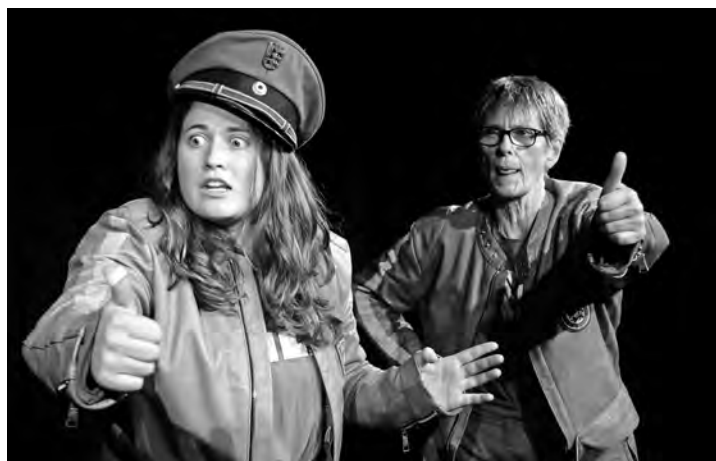
„Hammel und Bammel“ feiern Premiere im „Tellplatz-Casino“.

Die Verkehrspolizisten „Hammel und Bammel“ sind gesetzestreue Beamte. Voller Freude erfüllen sie die Ihnen aufgetragenen Anweisungen - natürlich ohne sie zu hinterfragen. Der Gehorsam wird ihnen zum Verhängnis! Eine Schauspielclownerie zum Schmunzeln, Lachen und sich Selbsterkennen. Geeignet ist der Doppelabend für alle Menschen ab 12 Jahren. Neben der Premiere am 13. Januar 2022 sind „Hammel und Bammel“ und „Vom Fischer und seiner Frau“ auch am 14., 20. und 21. Januar im „Tellplatz-Casino“ zu sehen. Beginn ist jeweils 20 Uhr. Tickets sind unter Telefon (07222) 968790 oder im Web auf www.volksschauspiele.de erhältlich. Karten kosten auf allen Plätzen 12 € pro Person. Für Schüler und Studenten gibt es an der Abendkasse 2,50 € Ermäßigung.