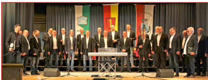
MännerStimmen der StimmKultur