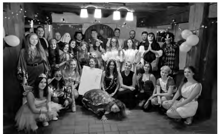
32 junge VSÖ-Mitglieder verbrachten das Wochenende auf dem Abrahamshof in Wolfach

Als Einstieg war das Motto des Freitagabends eine „First-Letter-Party“. Die Teilnehmenden trugen Kostüme, die mit dem ersten Buchstaben ihres Namens begannen. Die Outfits waren äußerst kreativ und erstaunlich vielfältig, wobei die Teilnehmenden ihre Persönlichkeit und ihren Einfallsreichtum zum Ausdruck brachten. Der verregnete Samstag ließ leider keinen Spaziergang im Schwarzwald zu. Nichtsdestotrotz konnte sich das Programm des Tages sehen lassen: Vormittags war eine Yoga-Einheit geplant. Neben der körperlichen Aktivität, die auch für einige Lacher sorgte, gab es hier Momente der Ruhe und Entspannung. Das absolute Highlight war jedoch das Krimidinner. Die Teilnehmenden tauchten in die Welt der 1950er-Jahre in New York und mussten einen Mordfall lösen.