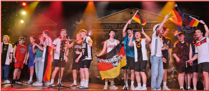
Die jungen Lerchen