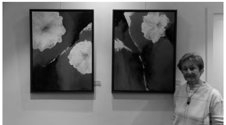
Blütenträume: Brigitte Forcher neben einem ihrer Doppel-Gemälde im Café Schröder in Steinmauern.

Landschaftseindrücke, abstrakte Kompositionen und florale Motive: KKÖ-Mitglied Brigitte Forcher zeigt derzeit im Café Schröder, Plittersdorfer Straße 2 in Steinmauern einige ihrer neuesten Gemälde. Die großformatigen Werke können voraussichtlich noch bis Ende März jeweils Montag bis Freitag 6 bis 18 Uhr, Samstag 6 bis 17 Uhr und Sonntag von 7.30 bis 17 Uhr zum Beispiel bei einer Tasse Kaffee und einem Stück Kuchen im Sitzbereich bewundert werden.