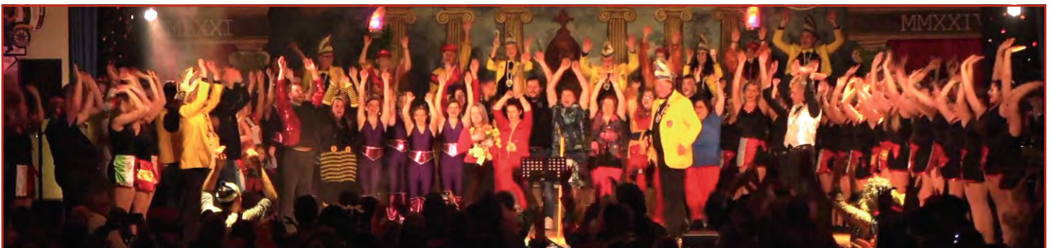
Danke „Aknös“ für die vielen lustigen Momente!