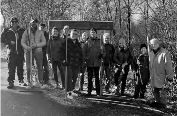
Die Helferinnen und Helfer vor dem Stationenweg

Auch im kommenden Jahr findet diese Aktion statt. Traditionell am letzten Samstag im Januar.