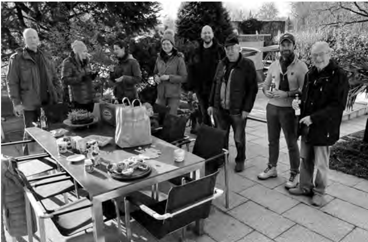
Auch die Stärkung darf nicht fehlen