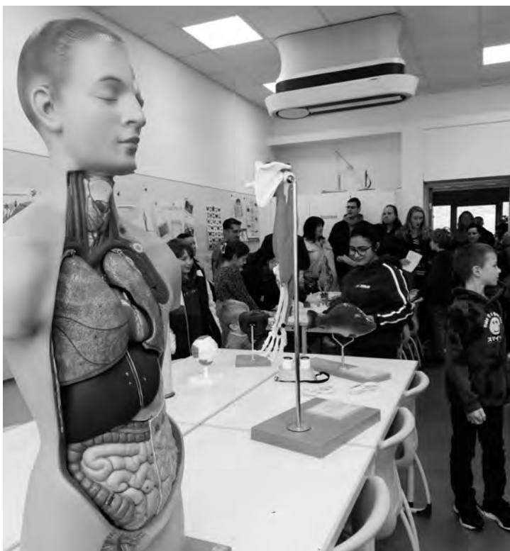
Insbesondere unsere jungen Besucher*innen konnten die Schule auf Herz und Nieren untersuchen.