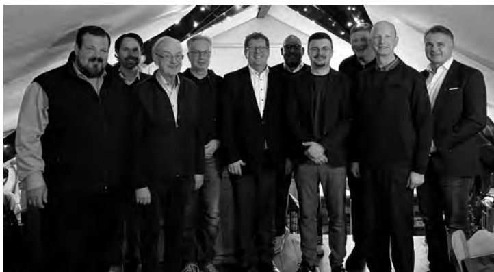
Die neue (und alte) Vorstandschaft der CDU Ötigheim.