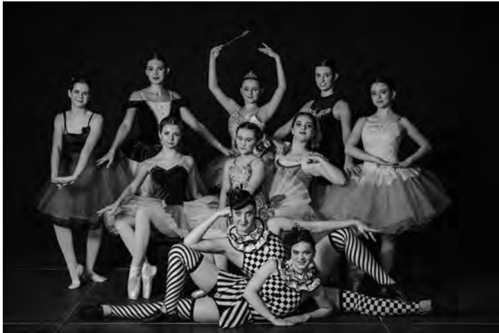
Das VSÖ-Ballett tanzt in der BadnerHalle „Die Puppenfee“

In einem Puppenladen herrscht reges Treiben: Eine Puppenmacherin stellt Puppen her und pflegt sie zusammen mit ihren Verkäuferinnen. Kunden kommen und gehen, bestaunen und kaufen die wunderschönen Puppen, die die Puppenmacherin extra für sie tanzen lässt. Puppen in bunten Kostümen zeigen ihr Können: Eine Tirolerin, eine Spanierin, Harlekin, Zinnsoldaten, Matrosen, Stofftiere und viele mehr. Allabendlich schließt die Puppenmacherin die Türe ihres Ladens und geht nach Hause - dann erscheint die Königin der Puppen und erweckt alle Spielzeugpuppen zum Leben.