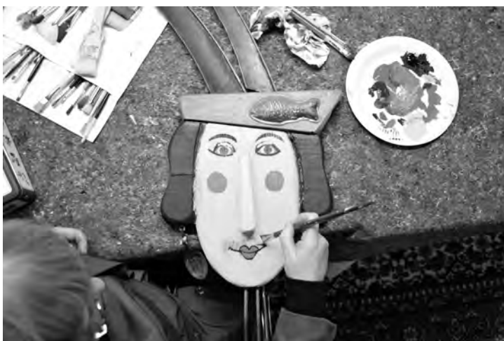
Frischer Teint: Auch die Dame mit dem Fischhut strahlt wieder wie in jungen Tagen.