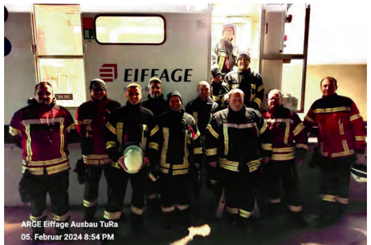
ARGE Eiffage Ausbau TuRa 05. Februar 2024 8:54 PM

Am Montagabend fand für eine Gruppe unserer Atemschutzgeräteträger sowie eine Abordnung der Feuerwehr Rastatt, Abteilung Niederbühl eine Einweisung auf dem Rettungszug der Firma Eiffage am Südlichen Portal der Tunnelbaustelle in Niederbühl statt.